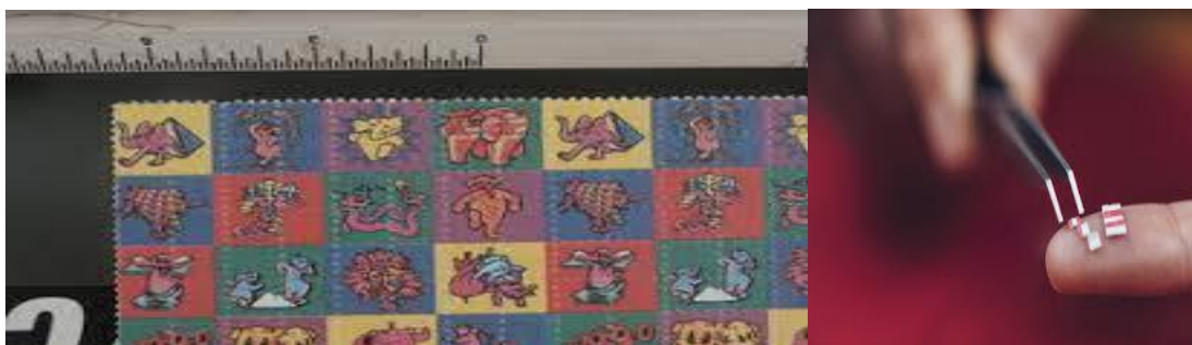
ب) LSD