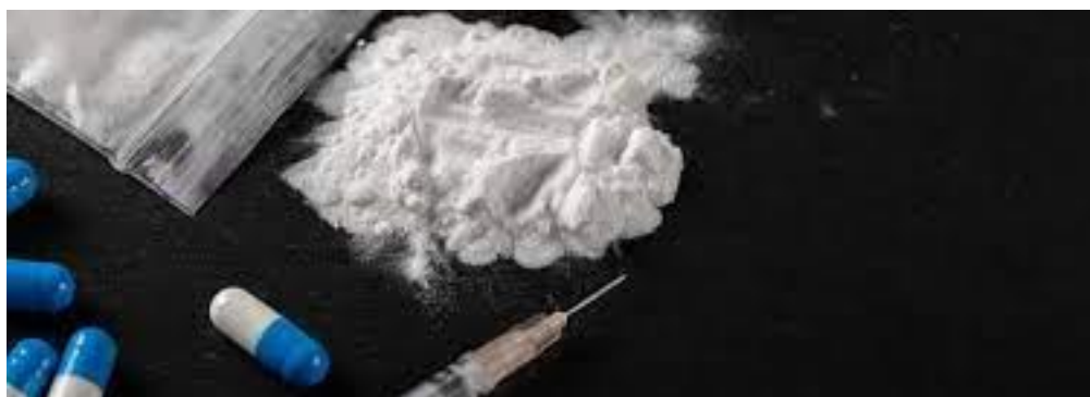
الف) فن‌سیکلیدین