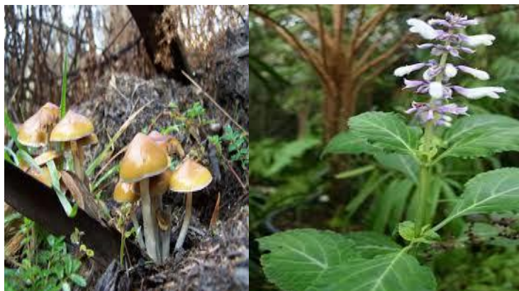
Magic Mushroom (د) Salvia Divinorum (ج)