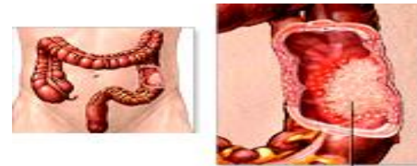
سرطان روده بزرگ

سرطان نوعی بیماری است که در آن سلولهای غیرطبیعی در بعضی از بافتها یا اعضای بدن خارج از کنترل طبیعی شروع به رشد و افزایش تعداد می کنند. در زمان حیات سلولهای طبیعی بدن در طی یک روند کنترل شده بازسازی و تکثیر می شوند. این امر باعث رشد طبیعی بدن و ترمیم بافتهای صدمه دیده و زخمها می گردد. وقتی که سلولها خارج از چهارچوب طبیعی رشد کنند، توده ای از سلولها را به وجود می آورند که به آن تومور می گویند. بعضی از تومورها فقط در مکان ایجاد خود رشد کرده و بزرگ می شوند که به آنها تومورهای خوش خیم می گویند، بعضی از تومورها نه تنها در محل پیدایش خود رشد می کنند، بلکه توانایی مهاجم و تخریب بافتها و اعضای اطراف را داشته و می توانند به نقاط دور دست بدن گسترش پیدا کنند. این تومورها را تومورهای بدخیم یا سرطانی می گویند. گسترش به نقاط دور دست بدن هنگامی اتفاق می افتد که سلولهای بدخیم از محل اولیه خود جدا شده و از طریق جریان خون یا دستگاه لنفاوی بدن منتقل گشته و در نقاط جدید تومور جدیدی را ایجاد نمایند. به این تومورهای جدید متاستاز می گویند.